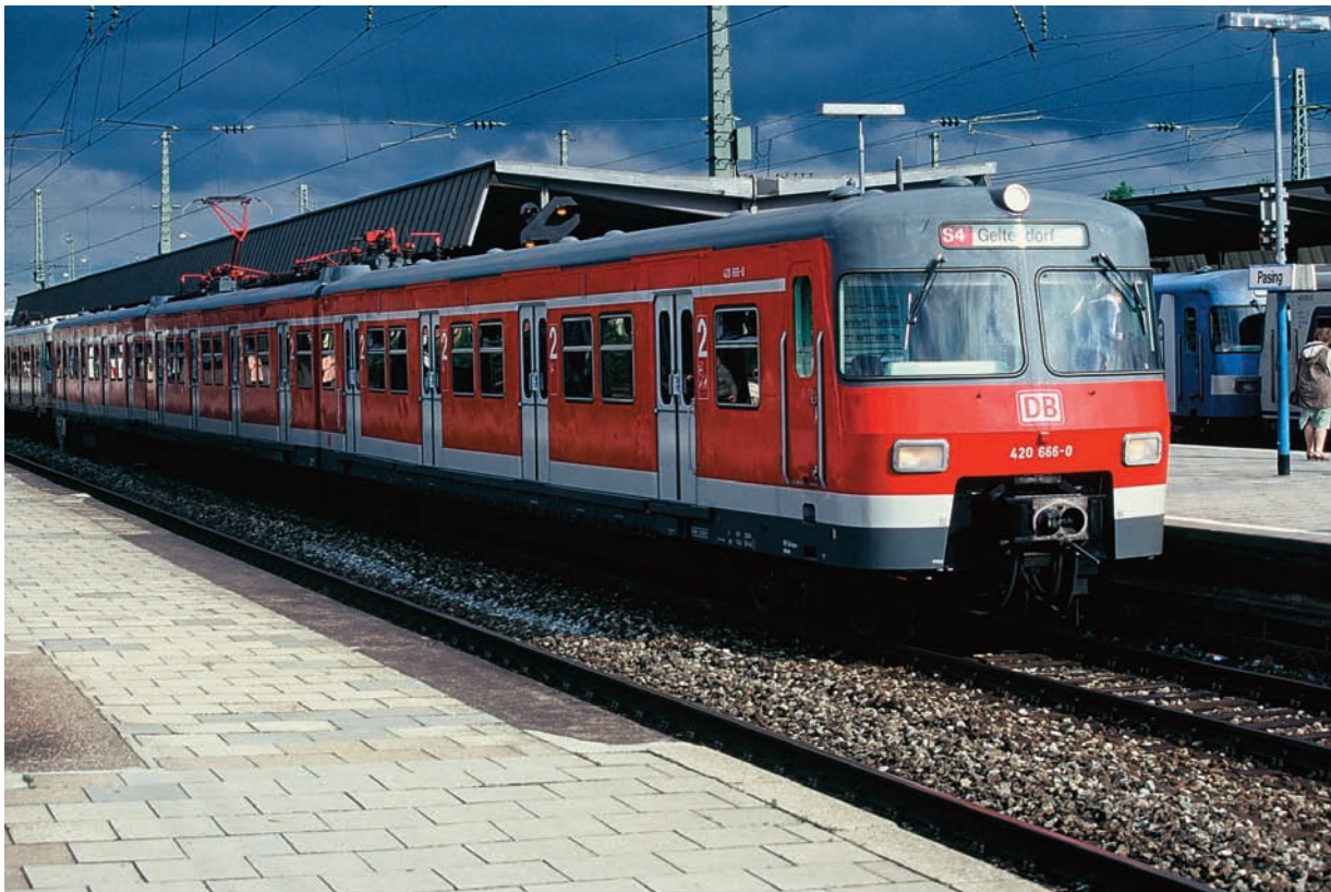
420 166 war einer der ersten Münchner 420er, die die aktuelle Farbgebung "verkehrsrot" erhielten. Im Juli 1997 war er auf der S4 nach Geltendorf unterwegs, hier in München-Pasing.