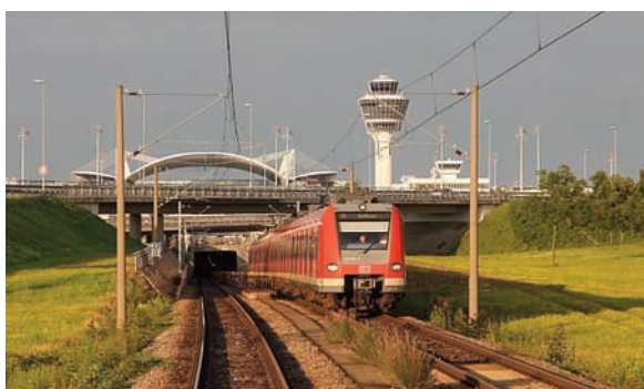
423 097 auf dem Weg nach München

Im Laufe der Jahre änderte sich immer wieder der Linienweg der S8. So verkehrte sie ab Ende 2000 von Pasing aus weiter bis Nannhofen und ersetzte die bis dahin auf dieser Strecke