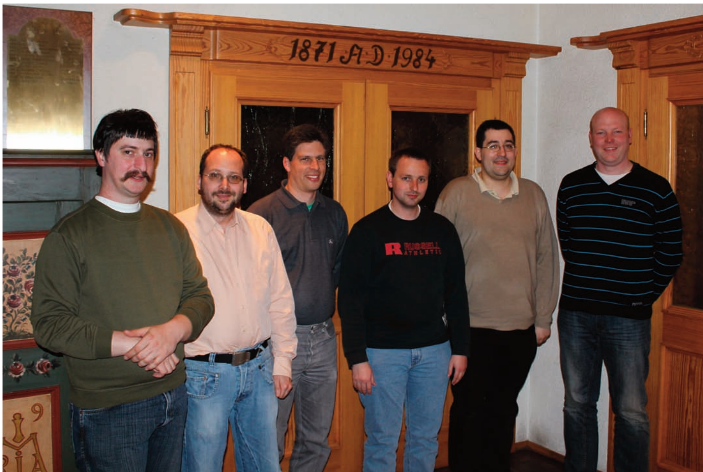
Der neue Vorstand der IG S-Bahn München e.V.