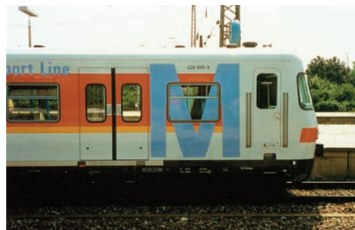
420 400 in München-Pasing

Für den Betrieb der Flughafen-S-Bahn wurden 21 Fahrzeuge der Baureihe 420/421 benötigt. Neben 15 umgebauten Fahrzeugen der 2. Bauserie wurden zuerst 6 Fahrzeuge der 7. Bauserie, die leihweise aus Stuttgart kamen, eingesetzt. Als erster Zug im "Flughafendesign" wurde 420 182 bei einem feierlichen "Roll-Out" im S-Bahn-Betriebswerk Steinhausen der Öffentlichkeit vorgestellt. Mitte 1993 folgten die 6 Fahrzeuge der 7. Bauserie und lösten die Leihfahrzeuge aus Stuttgart ab.