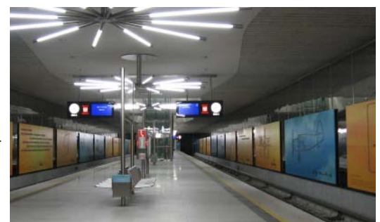
U-Bahnhof Garching-Forschungszentrum

Der U-Bahnhof Garching ist in zwei Röhren unterteilt (wie z.B. Trudering) und mit Motiven aus