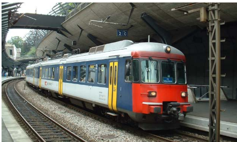
RABDe 510 im Bahnhof Stadelhofen.

Die Doppelstock-Pendelzüge (DPZ) sind vierteilige Kompositionen bestehend aus der Lokomotive Re 450, einem 1./2., einem Zweitklass-Wagen, sowie einem Steuerwagen. Der DPZ ist das Fahrzeug der Zürcher S-Bahn. Eine Komposition ist rund 100 Meter lang.