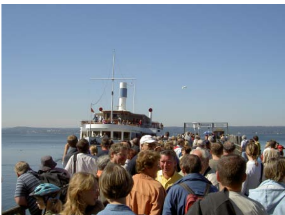
Der Schaufelraddampfer "Diessen" am Anlegesteg in Herrsching.

Am 9.9.2006 führte unsere Sonderfahrt nach Herrsching. Wir fuhren an diesem Samstag bei strahlendstem "Papst-Wetter" pünktlich um 9:44 Uhr vom Ostbahnhof, wie immer von Gleis 11 ab. Mit 113 Fahrgästen aller Altersklassen war unser Zug auch gut gefüllt. Die Fahrt führte über Daglfing, Johanneskirchen und Freimann zum Rangierbahnhof München Nord. Dort gab es neben den fachgerechten Erläuterungen unseres Moderators auch für die Fahrgäste einiges zu sehen.