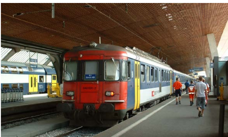
RBe 540 im Zürcher Hauptbahnhof.

Die RABDe 510-Triebzüge bestehen aus drei Wagen. Beschafft in den sechziger Jahren für die Goldküste (Zürich - Meilen), wurden die Triebwagen in den neunziger Jahren modernisiert und kamen dann auf verschiedenen Linien zum Einsatz. Wenn die RABe 514 ausgeliefert sind, wird der Mirage verschrottet.