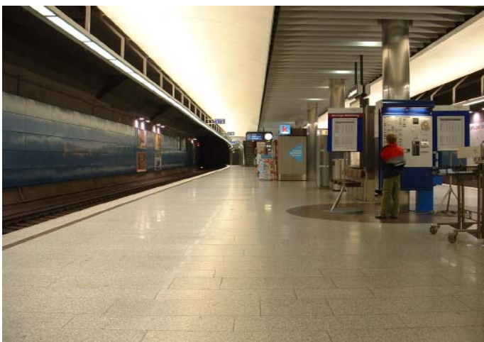
Bahnhof Zürich HB SZU

In den folgenden Jahren wurde das Netz weiter ausgebaut. Doppelspurausbauten und neue Zugangsstellen sorgten für ein Benutzerfreundliches S-Bahnsystem. Um Platz zu machen für den zweiten unterirdischen Durchgangsbahnhof (Bahnhof Löwenstrasse) wurde im Bereich der Sihlpost ein Aussenbahnhof errichtet. Auf diesem enden die S-Bahnen aus Richtung