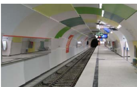
U-Bahnhof Garching

Garching verziert worden. In Garching-Forschungszentrum werden auf Wandtafeln berühmte und der Öffentlichkeit unbekannte Wissenschaftler aller Forschungsbereiche dargestellt, die in Beziehung zu den in Garching beheimateten Institutionen stehen. Insgesamt kostete die Verlängerung der Strecke 161 Millionen Euro und das Münchner U-Bahnnetz ist somit auf eine Gesamtstreckenlänge von 98,4 km angewachsen. (gh)