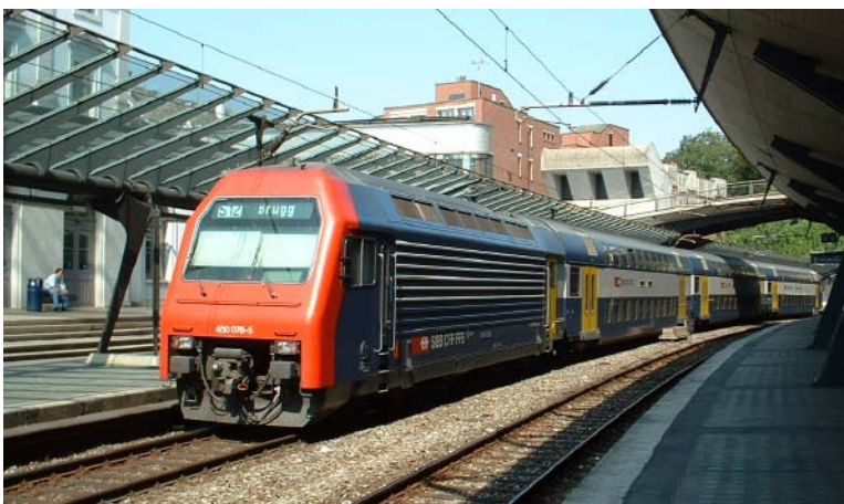
Baureihe Re 450 im Bahnhof Stadelhofen.